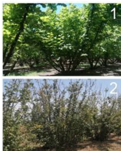
Fotografías. 1. Finca de avellanos en regadío sin estrés hídrico. 2. Finca de avellanos sin producción debido a una sequía extrema prolongada.

El agua residual depurada se plantea como solución a corto plazo para el riego del avellano, muy sensible a las sequías (Foto 2). Los resultados obtenidos en el Grupo Operativo REGSUNUT servirán para poder recomendar (o no) al sector de la avellana del Camp de Tarragona el uso del agua residual depurada para el riego y las dotaciones de agua necesarias (las características y el manejo) para producir de forma sostenible y rentable avellana de calidad.